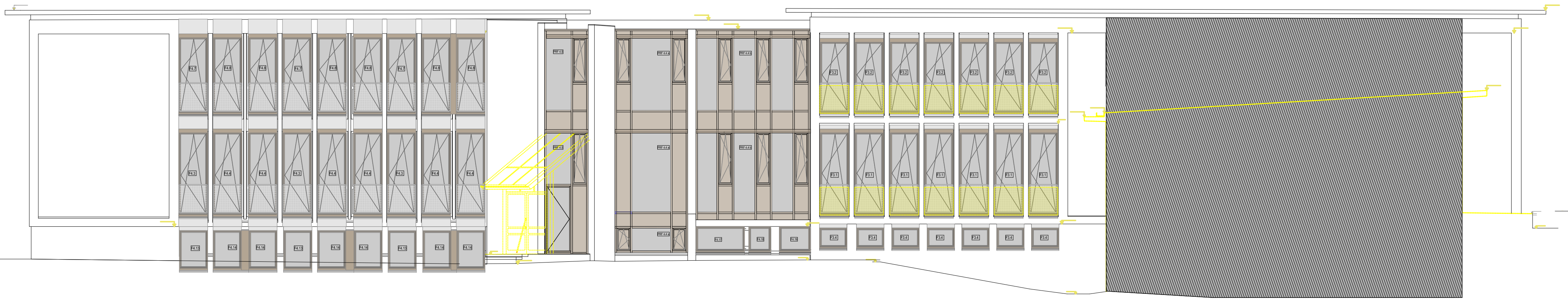
Nordwesten BA 3_4.2